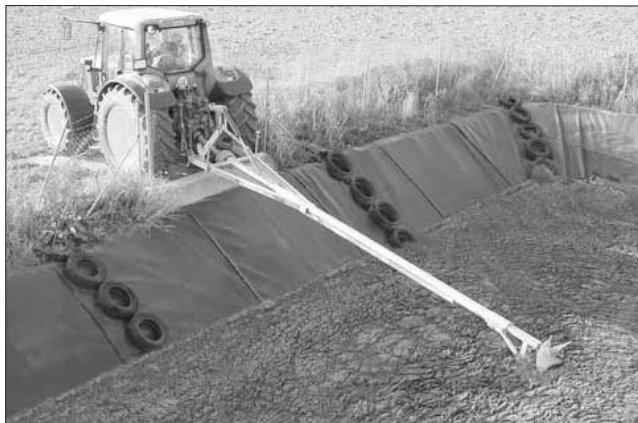
Os principais riscos no traballo con zurros veñen derivados por inhalar, involuntariamente, emanacións de ácido sulfhídrico

Os zurros e as dexeccións líquidas limpeza ou mantemento. O principal (SH 2 ). No presente texto de Fouce, supoñen un importante factor de risco axente de risco nos depósitos de residuos gandeiros (fosas de zurro) e, en consecuencia, o principal causante de mortes nesa tarefa é o ácido sulfhídrico analizaremos polo miúdo os factores de risco ligados ao contacto con este ácido nas fosas de zurro e daremos consellos para evitar accidentes.