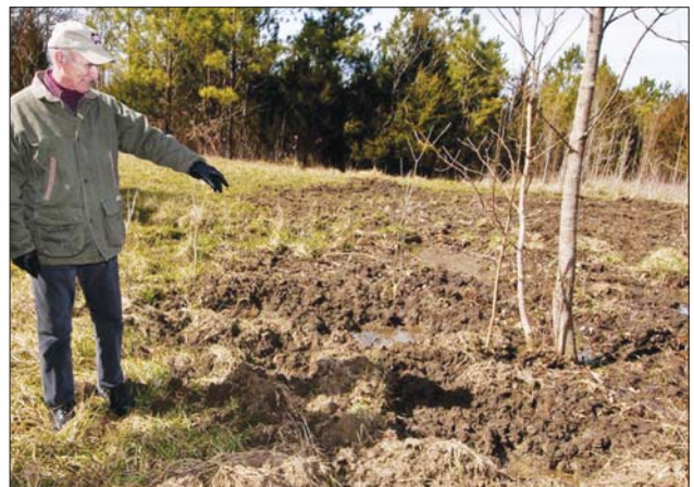
A falla de medidas contra os ataques do xabaril por parte da Xunta, obrigou ao SLG a buscar alternativas á marxe da Administración

Para desenvolver esta colaboración, estase a facer un traballo de identificación das zonas máis vulnerables, polo que dende as oficinas do Sindicato Labrego en Compostela estase a recoller información sobre os danos provocados polo xabaril nas explotacións agrogandeiras e forestais durante os dous últimos anos. É por isto que, dende o SLG, se fixo un chamamento a todas aquelas gandeiras e gandeiros que sufran ataques de xabaril, no período de tempo devandito, para que se acheguen a