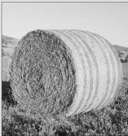
A seca disparou o prezo da alimentación animal

■ Para unha explotación de vacún para carne, a herba seca que adquire fóra, que habitualmente é dunha calidade paupérrima, está entre 45-50 euros o rulo. Sumándolle os concentrados para facer unha porción equilibrada, encarece; polo que neste sector moitas explotacións están a alimentar as súas reses con mes-