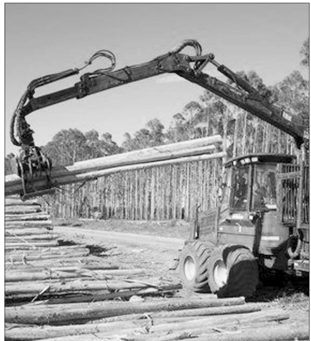
Con este borrador, Medio Rural pretende afondar nun modelo industrial de monte ao servizo do lucro das industrias enerxéticas

Hai que rexeitar de cheo a afirmación da necesidade de produción de enerxía eléctrica en Galicia. Somos un país excedentario e exportador. Non se fala pola contra de como cubrir as necesidades enerxéticas e alimentarias das explotacións e dos moradores do medio rural con produción propia e eficiente favorecendo o desenvolvemento de enerxías alternativas para autoabastecemento. O fin das políticas enerxéticas é favorecer a acumulación de capital das empresas. A industrialización e destrución do medio rural e dos nosos montes, vai parella á expulsión dos labregos e labregas e deriva nun medio rural sen persoas, afectando dende o campo a toda a sociedade.