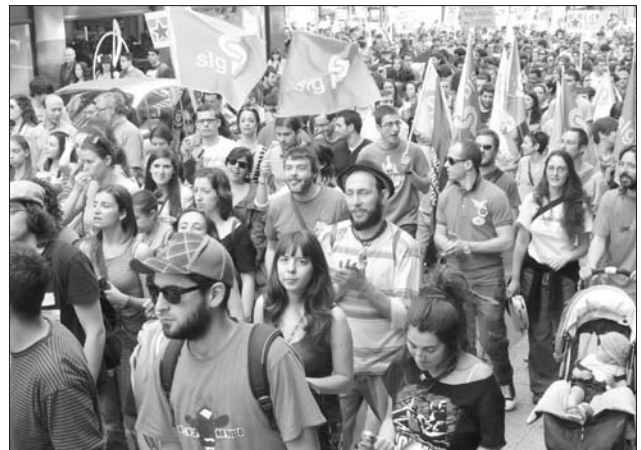
A folga xeral foi secundada por manifestacións multitudinarias nas principais vilas e cidades galegas, como esta de Compostela

zonas rurais de Galiza estamos quedando sen atención médica, sen servizos sanitarios de urxencia próximos, sen farmacias de garda, sen comedores escolares, sen escolas nin garderías para os nosos fillos e fillas, sen atención para os nosos e as nosas maiores, con oficinas agrarias comarcais cada vez con menos recursos, sen medios suficientes para prever incendios forestais, coa privatización e empeoramento progresivo dos servizos públicos prestados ás explotacións, etcétera”.