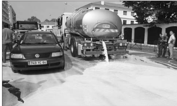
O descontento polas políticas leiteiras comunitarias xa ten levado as protestas do sector até as mesmas rúas de Bruxelas

2. Negociación colectiva do prezo en interprofesionais nas que estean representados os axentes do sector: explotacións, industrias, distribución, consumidores e consumidoras e administración.