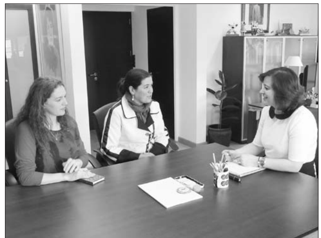
A Secretaría Xeral de Igualdade volverá financiar o programa Punto Delas, que desenvolve o SLG nas principais comarcas galegas

tente na creación de centros comarcais de información especializada para facilitar ás mulleres que viven no medio rural un servizo de atención sen necesidade de desprazarse fóra do seu domicilio, superando as dificultades de factores como a dispersión xeográfica, o envellecemento da poboación ou a menor oferta de servizos e infraestruturas no medio rural.