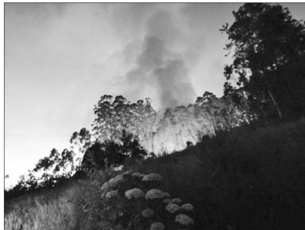
A proliferación incontrolada de plantacións ilegais de eucalipto está a fomentar vagas de lumes forestais, mesmo en pleno inverno

O incendio das Fragas do Eume foi un claro reflexo de