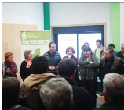
As novas instalacións do Sindicato Labrego mellorarán o servizo ofrecido á afiliación de Valdeorras (dereita) e Tabeirós-Terra de Montes (esquerda)

O Sindicato Labrego inaugurou novos locais para a comarca de Valdeorras, na localidade de Vilamartín, o 11 de abril; e para a bisbarra de Tabeirós-Terra de Montes, na vila da Estrada, o 25 de abril. O local valdeorrés, na rúa Miguel de Cervantes 15, aproveitou as instalacións das oficinas da antiga Extensión Agraria, que nos últimos tempos estiveron pechadas por falla de uso. No caso estradense, a nova sede está na rúa Grandín 1. Ambas inauguracións estiveron arropadas pola afiliación de cada zona e a elas asistiu a secretaria xeral do SLG, Carne Freire.