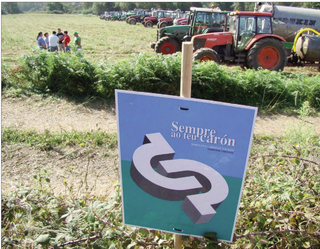
Ferrollterra, vintecincos de setembro. Dazaseis cisternas con 80.000l. de leite provinte de explotacións de nove concellos da comarca.

L abregas e labregos de todo o mundo estamos unidos polas mesmas loitas, e o nosos inimigos comúns son as grandes multinacionais respaldadas polos gobernos que deseñan leis á medida destes monstros do mercado. Dende comezo de ano, milleiros de membros das organizacións da Vía