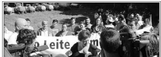
COMPOSTELA. [23 de setembro] Na primeira acción, en Nemenzo, verqueronse 60.000 litros de leite, transportado en 14 cisternas, e recollido en aproximadamente trescentas explotacións das comarcas do Xallas, Arzúa, Ordes, Compostela e Costa da Morte.

*[Extractos do Contrato Homologado actualizado*]