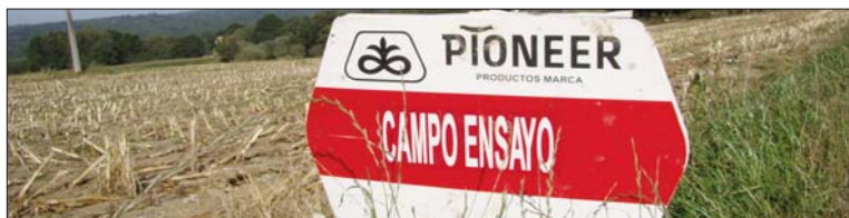
Cartaz de campo experimental atopado na zona de Vilalba. As multinacionais da agroindustria, as nosas inimigas coma produtoras e produtores de alimentos, intensificaron recentemente a súa presenza na Galiza. O pasado 5 de outubro, MONSANTO xuntou en Ordes a 430 gandeiros de todo o país nunha leira sementada con máis de 12 variedades de millo distintas.

No momento en que os pobos exercemos os nosos dereitos e resistimos este refugallo xeneralizado, ou cando somos obrigados a