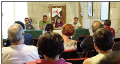
Canda a CIG e a CUT, na mesa redonda “Alternativas á crise”, que tivo lugar o 5 de setembro enmarcada no XIII Festival de Poesía do Condado.