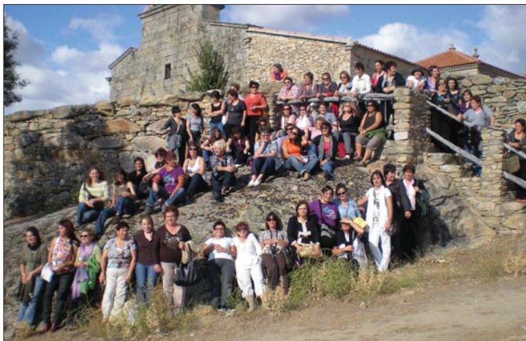
Como acontece sempre, destaca a sintonía e o compañeirismo entre mulleres que teñen unha das profesións máis importantes do mundo: alimentar as nosas sociedades e preservar un medio que tamén é fundamental para a vida.

A Comisión Europea e neste caso o Ministerio din e fan exactamente o contrario,