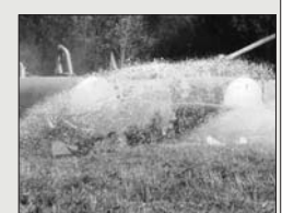
BETANZOS TEIXEIRO. [29 de setembro] Neste acto reivindicativo participaron aproximadamente 400 explotacións, pertencentes aos concellos de Sobrado, Curtis-Teixeiro, Vilasantar, Cesuras, Irixoa, Paderne, Vilarmaior, Monfero, Oza e Mesía, que aportaron un total de 90.000 litros de leite, transportado en 11 cisternas.