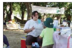
As cativas e cativos disfrutaron dun día de xogos.