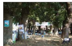
Paneis e imaxes do agro para decorar a carballeira.