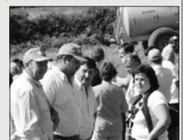
FERROLTERRA. [25 de setembro] Nesta acción reivindicativa espárese máis de 80.000 litros de leite, transportados en 16 cisternas, e provintes de explotacións de 9 concellos da comarca: San Sadurniño, Moeche, Ortigueira, Cerdido, Somozas, A Capela, Mugardos, Narón, e As Pontes.