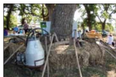
Exposición de apeiros do agro na carballeira de Trazo.

Nunha comarca leiteira como é Ordes, a preocupación pola crises que está a afectar as nosas explotacións ficou en todo momento presente, mais temos claro que as ganas de festexar todos e todas xuntas, non nolas poderán sacar nunca.