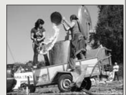
TERRA CHÁ. [28 de setembro] Nesta mobilización empregáronse aproximadamente 85.000 litros de leite, trasladados en 10 cisternas, e cedidos por unhas 450 explotacións da comarca aproximadamente, comprendendo os concellos de Abadín, Guitiriz, Xermade, Vilalba, Cospeito e Castro de Rei.