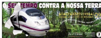
A necesidade de acadarmos a soberanía alimentar para Galiza foi o eixo protagonista desta palestra que tivo lugar na comarca da Seabra, dentro segunda edición do Acampamento de Montanha da Agrupación de Montanha Augas Limpas (AMAL) o pasado 19 de setembro.