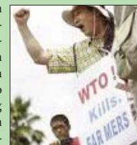
Lee Kyung Hae

Do vindeiro 30 de novembro ao 2 de decembro terá lugar Sétima Conferencia Ministerial da OMC en Xenebra. Até alí achegaranse as organizacións pertencentes á Vía Campesina.